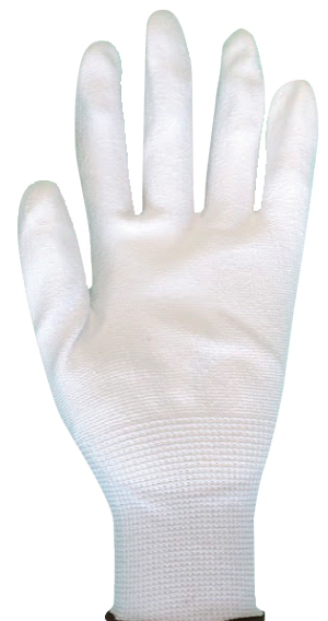
L サイズ (茶)