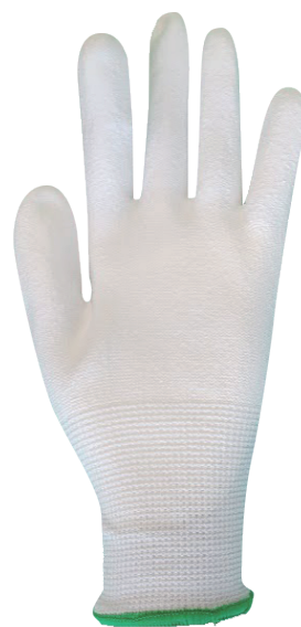
M サイズ (ライトグリーン)