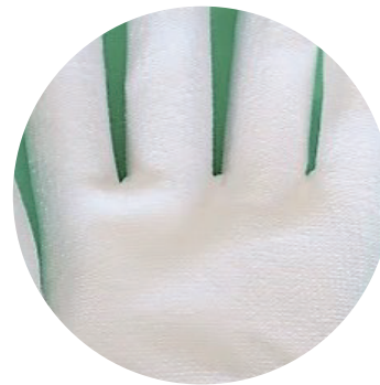
優れたグリップ力