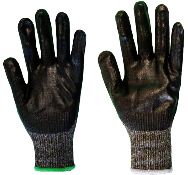
M サイズ (ライトグリーン)