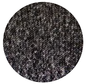
スチールワイヤ入